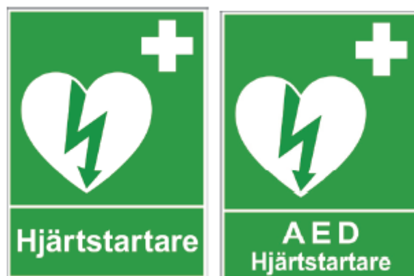
Figur 1— Exempel på skyltar enligt HLR-rådet

Hänvisningsskylt(ar) ska finnas i den utsträckning som motiveras av lokalers storlek och avstånd till hjärtstartaren.